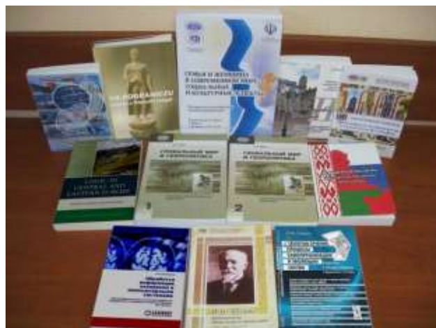
Издания Института философии НАН Беларуси, 2010 – 2014 гг.